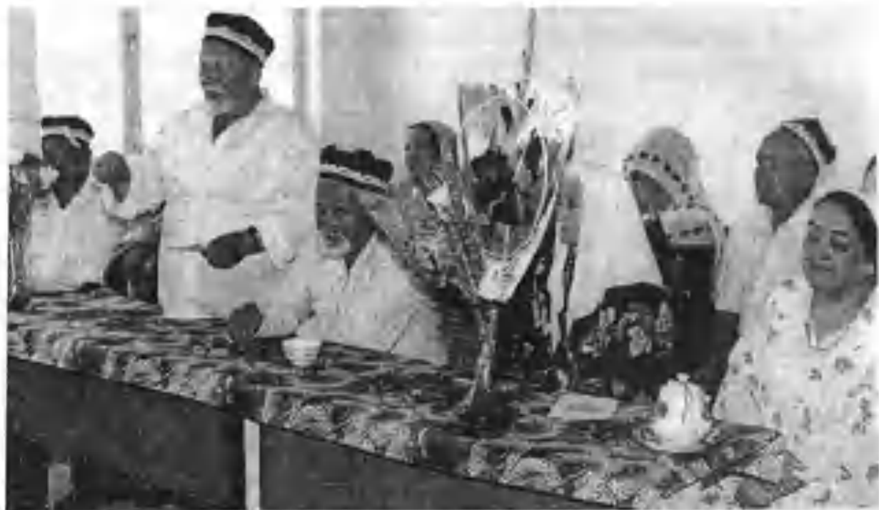
Андижон шаҳридаги 29-ўрта мактабнинг чорак асрлик юбилейи тадбирларида.