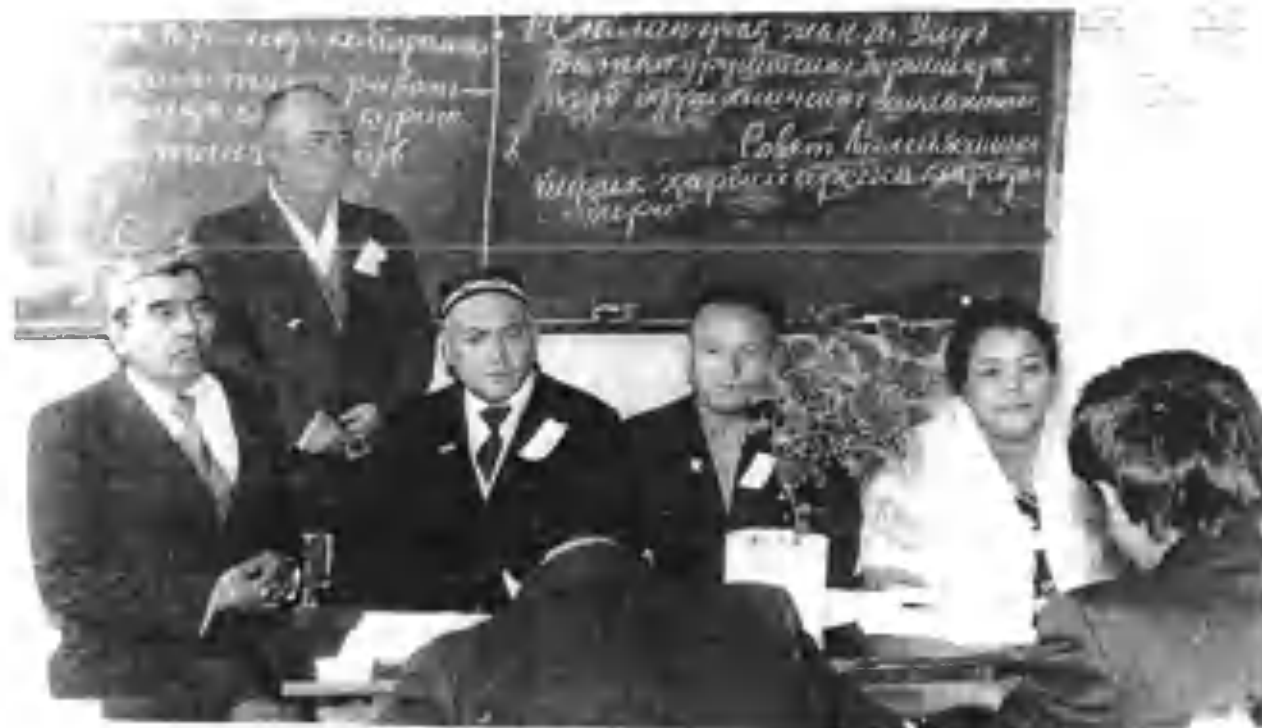
1987 йилда вилоятда ўтказилган тарих олимпиадаси ташкилотчилари.