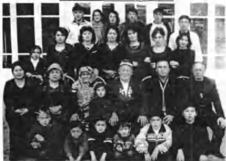
Домла оила аъзолари даврасида (2004 й.).