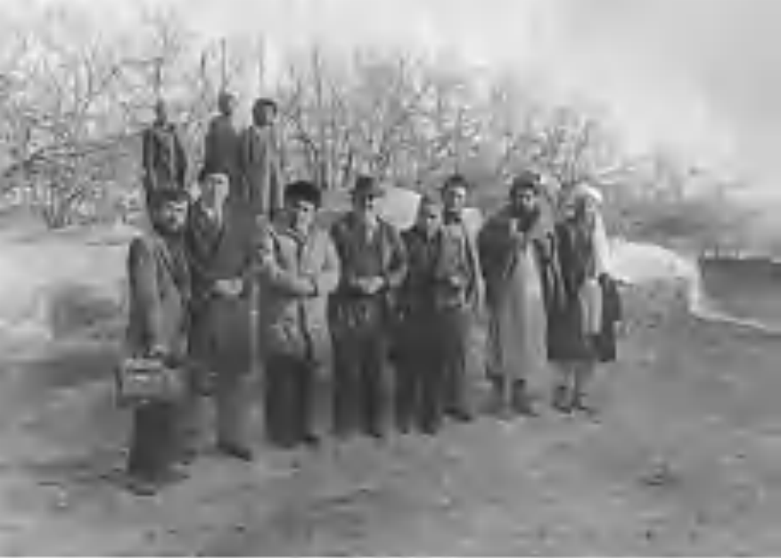
Экспедиция аъзолари Афғонистонда.