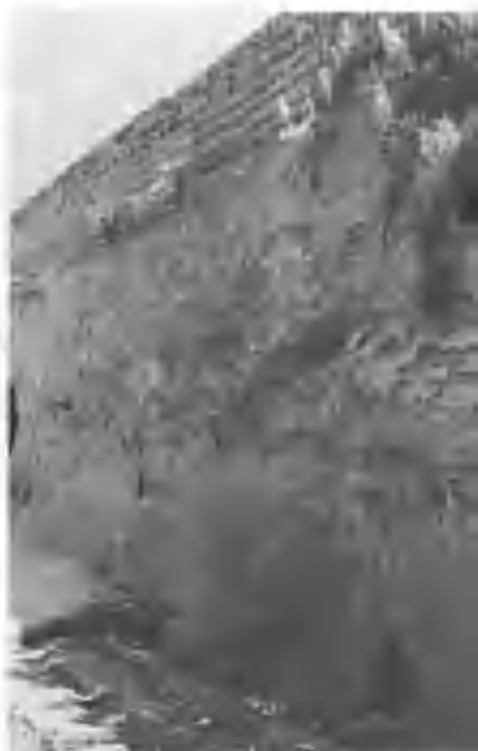
Арк девори қолдиқлари.