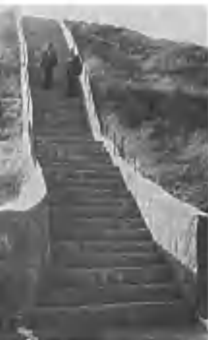
Лоткон тепага чиқиш йўли.