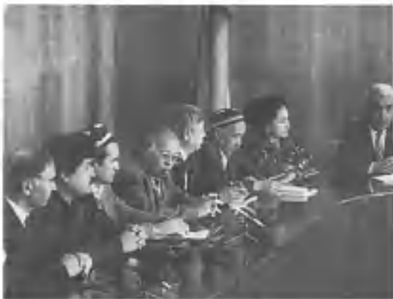
Бобур таваллудининг 510 йиллигини нишонлаш комиссиясининг йиғилиши.