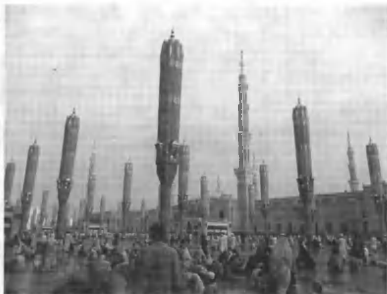
Мадинадаги «Масжидун Набий» ҳовлиси.

салом) Минога бораверишда шу ердан ўтганлар. У зотни васваса қилиб, қароридан қайтармоқчи бўлган шайтонга отиш ниятида тош олганлар. Пайғамбаримиз Муҳаммад мустафо (соллаллоху алайҳи ва саллам) ҳаж қилганларида Муздалифада шом ва хуфтон намозларини эрталаб бомдод намозини ўқиб, сўнг Мино тоғига йўл олганлар. Бу жойларда туриш ҳожига вожиб амал ҳисобланади. Кечани тоғ ён бағрида ўтказдик. 6 ноябр куни эрталаб бомдод намозини Муздалифада ўқиб, яна автобусларда Минога қараб йўлга тушдик.