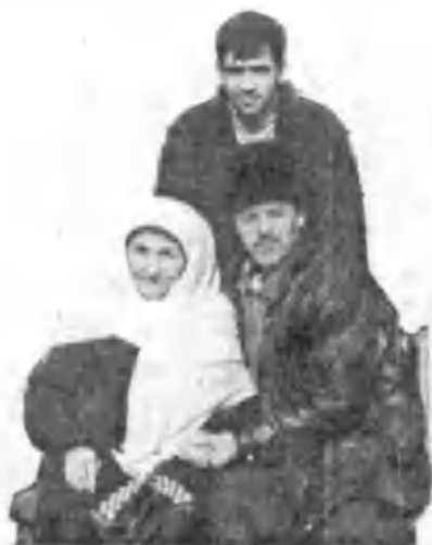
Shoirning onasi Enaxon aya farzandlari davrasida