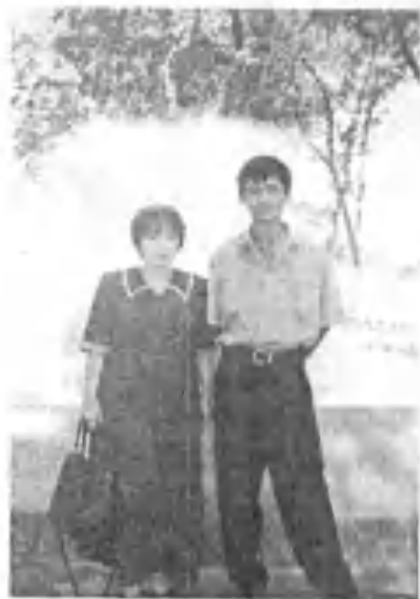
Shoirming rafiqasi va o'g'li