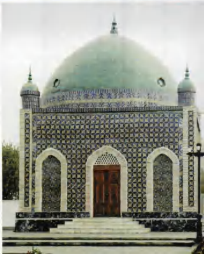
Бурхониддин Марғиноний (рамзий) мақбараси.