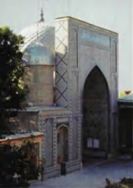
Занги ота ёдгорлик мажмуаси.