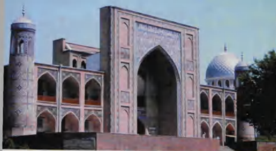
Тошкент. Кўкалдош мадрасаси.