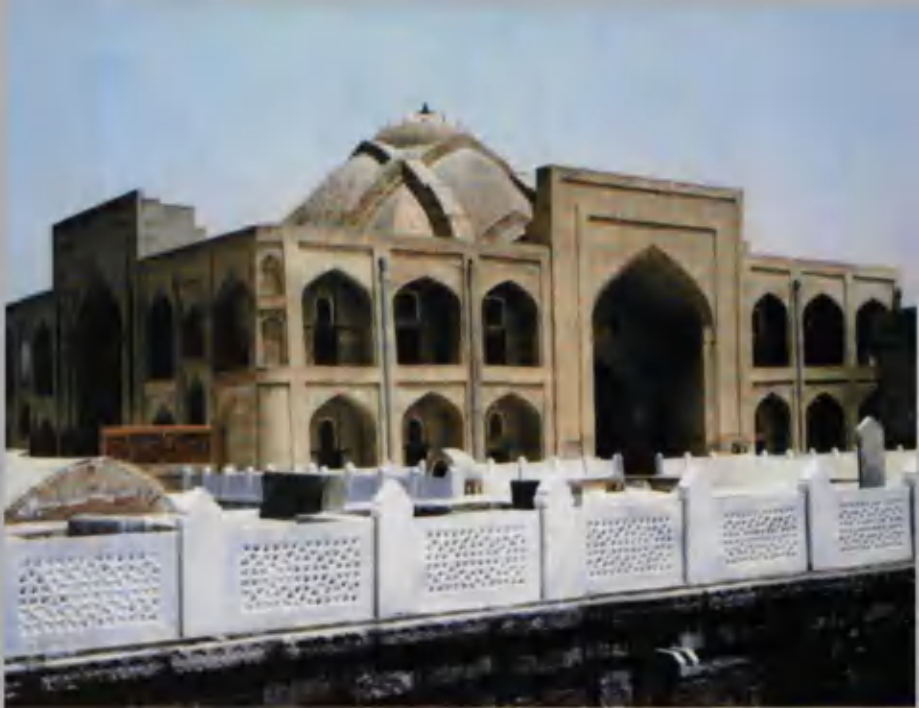
Ҳазрати Баҳоуддин Нақшбанд мажмуаси.