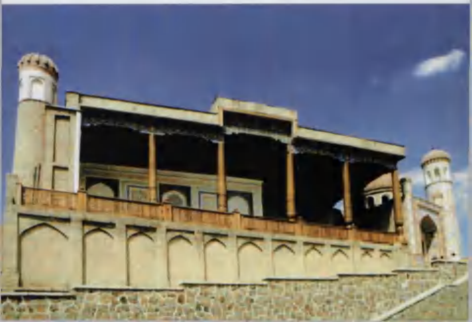
Ҳазрати Хизир масжиди.