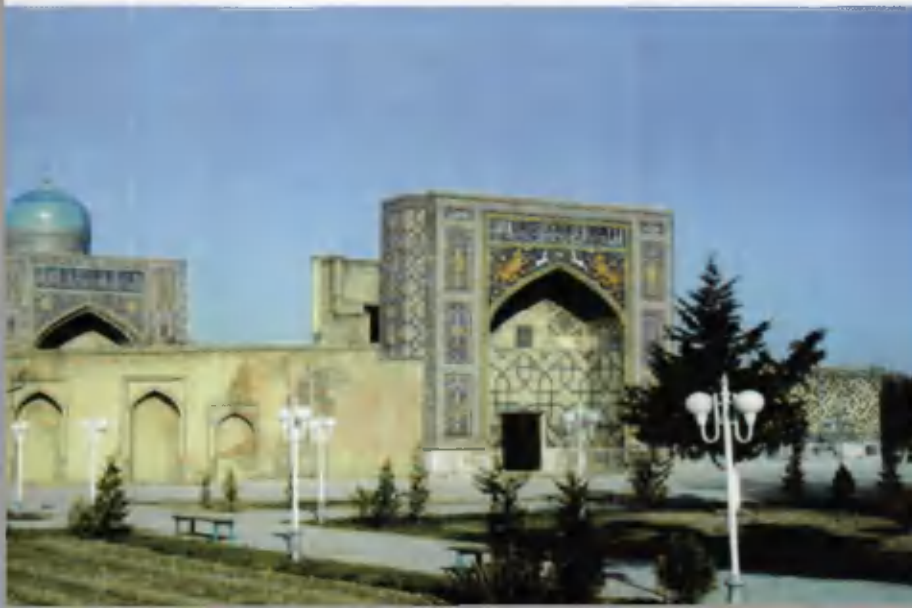
Самарқанд. Хожа Аҳрор Валий масжиди.