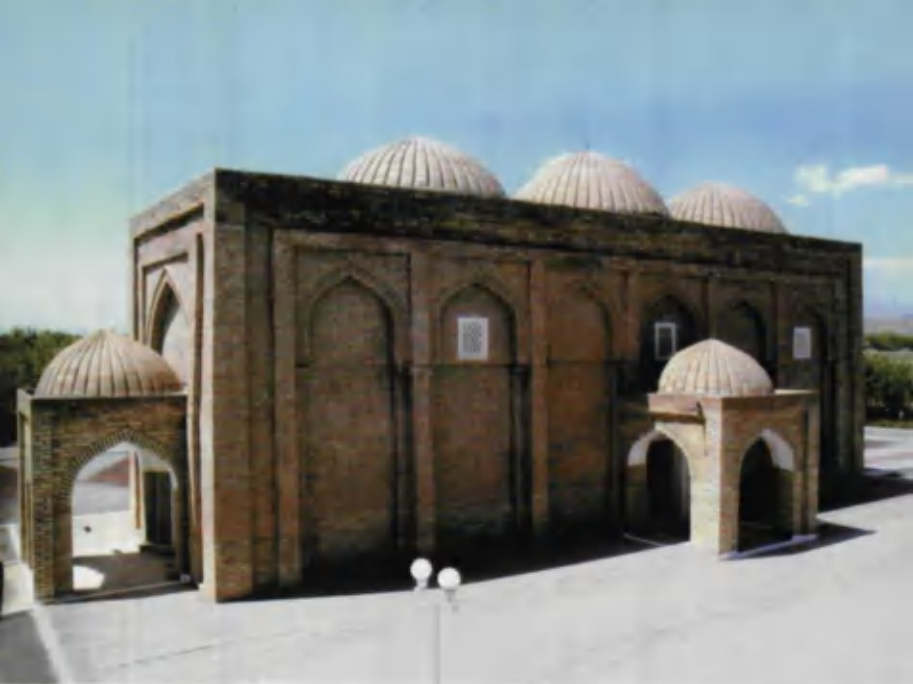
Абу Исо ат-Термизий мақбараси.