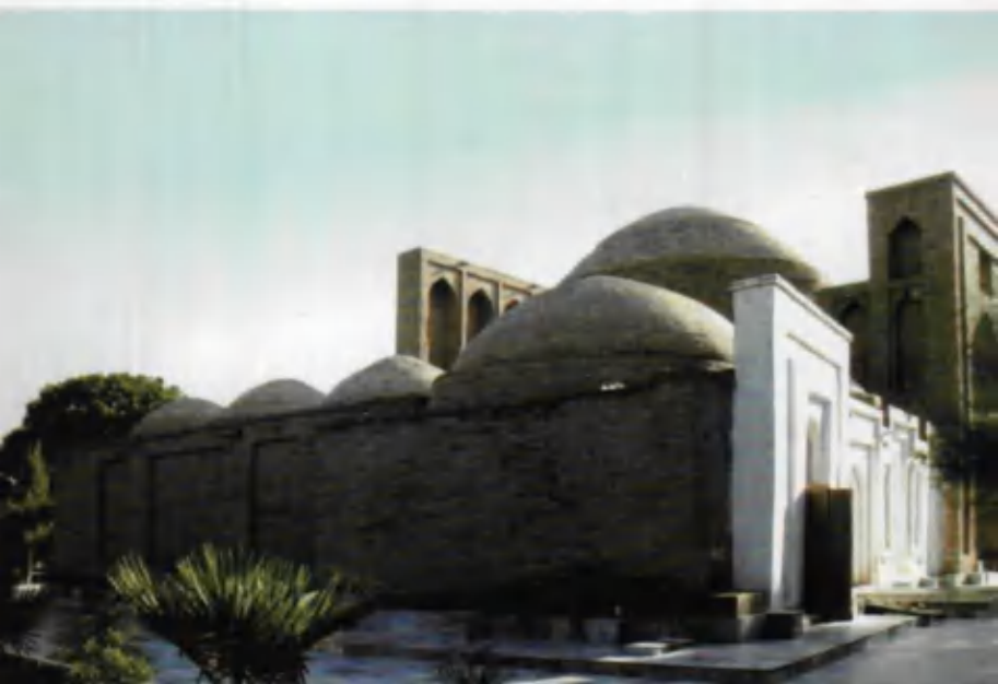
Ҳаким ат-Термизий ёдгорлик мажмуаси.