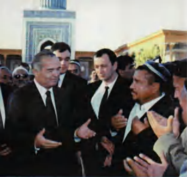
Ўзбекистон Республикаси Президенти Ислам Каримов маҳаллий ва чет эллик зиёратчилар орасида.