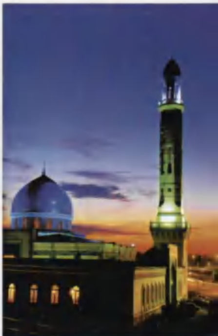
Шайх Зайниддин бобо масжиди.