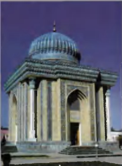
Имом Мотуридий мақбараси.