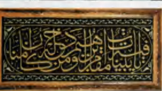
Кисва – Каъбалўш парчаси.