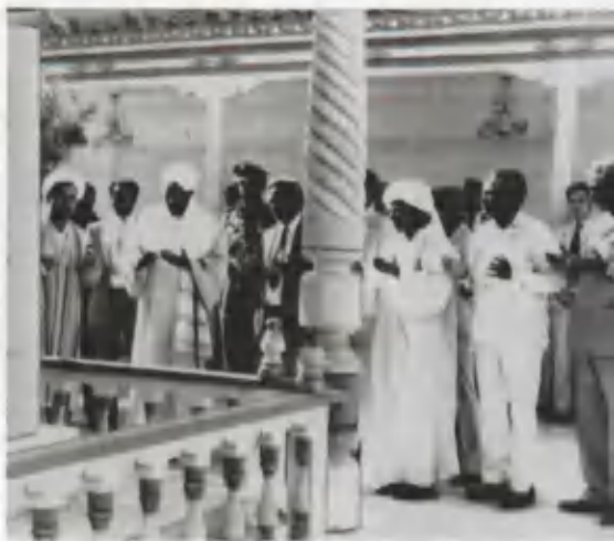
Имом ал-Бухорий мақ- барасининг илгариги кўриниши.