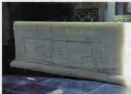
Туркия Республикаси Президенти Сулаймон Демирел зиёратда. Сағана.