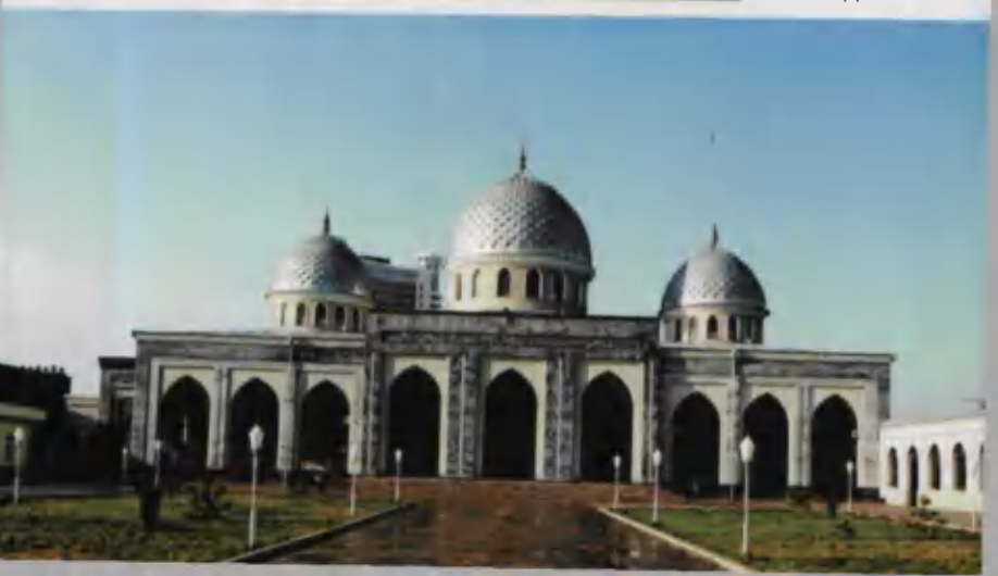
Хожа Аҳрор Валий масжиди.