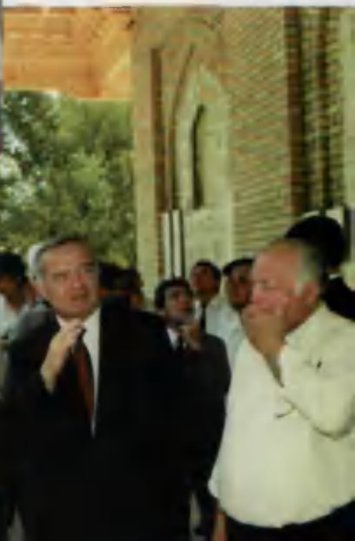
Ўзбекистон Республикаси Президенти Испом Каримов Имом ал- Бухорий мажмуи қу- рилишида.