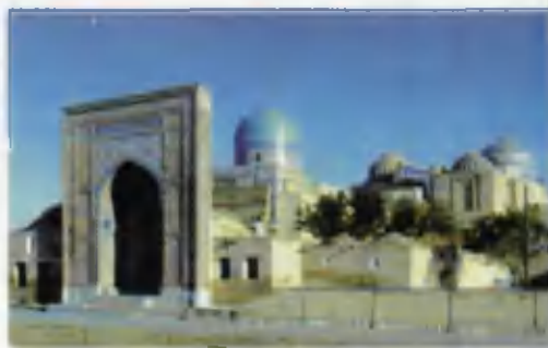
Шохи Зинда мажмуаси.