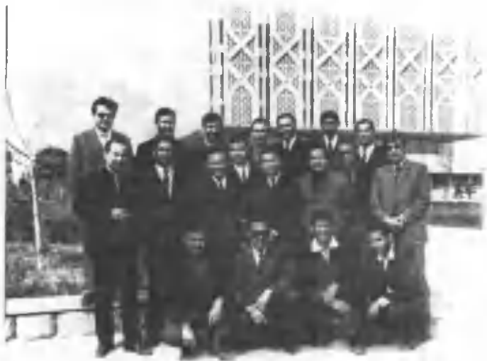
Олимнинг аспирантлик йиллари. 1974 йил