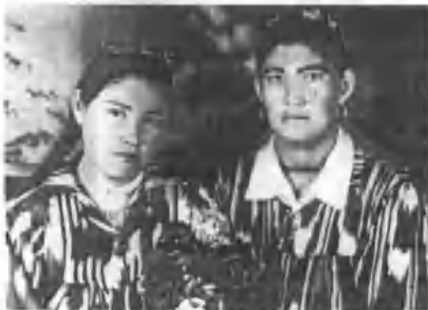
Синглиси ва рафиқаси