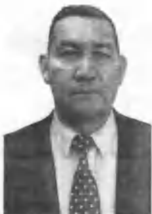
Олимнинг Термиз ДУ малака ошириш факультетининг деканлиги даври. 2002 йил 2 январь