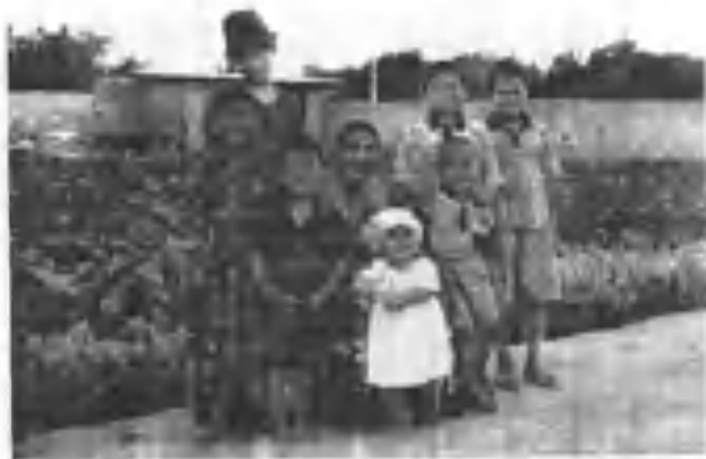
Олимнинг оиласи Ойсулук опа набиралари билан. 2004 йил