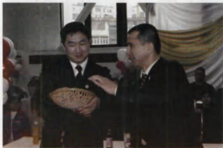
Таэквондонинг фалсафаси бор унда!