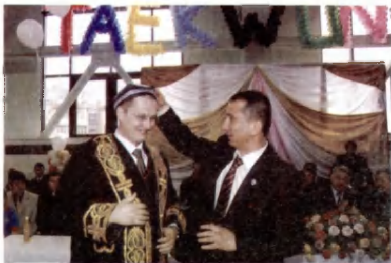
Ўзбекинг дўстиси ҳаммага ярашади