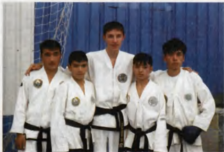
«Биз доим биргамиз...»