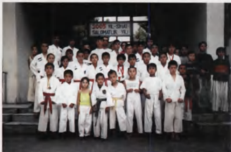
«Меҳрибонлик уйи»нинг ёш тажвондочилари