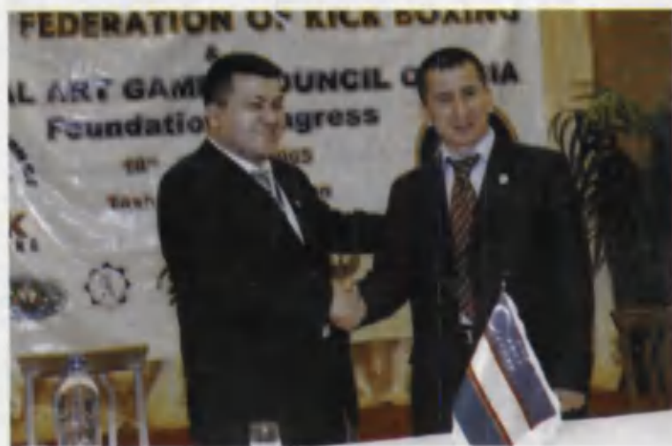
Кикбоксинг федерацияси президенти Сардор Тошхўжаевнинг кутлови