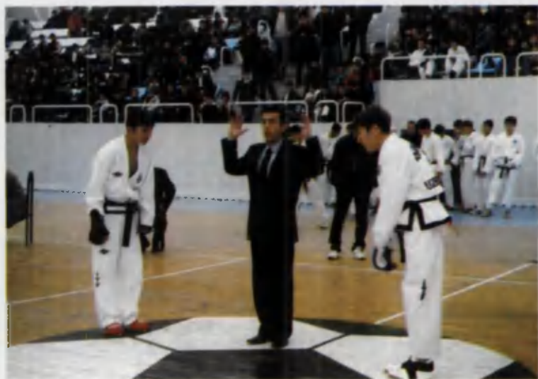
«Паҳлавон» спорт мажмуасидаги беллашув