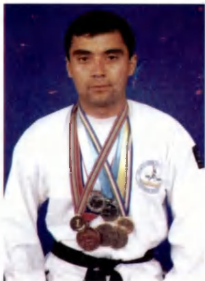
Медалларим — юртим шарафи