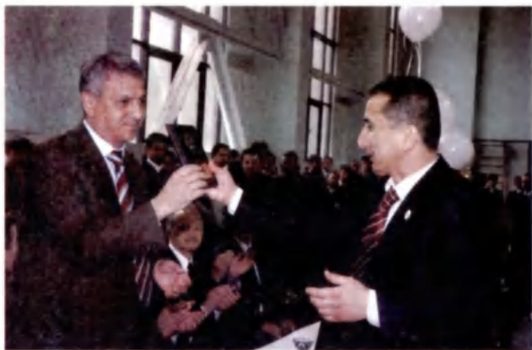
Сиз ҳам таэквондочи булдингиз