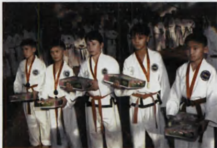
Эътибор учун раҳмат!