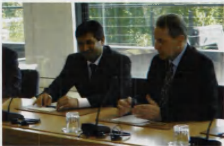
Кураш Халқаро Ассоциацияси президенти Комил Юсупов Халқаро Олимпия қўмитаси президенти Жак Рогге