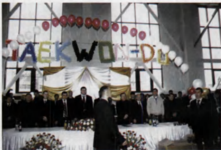
Мусобақаларнинг очилиш маросими