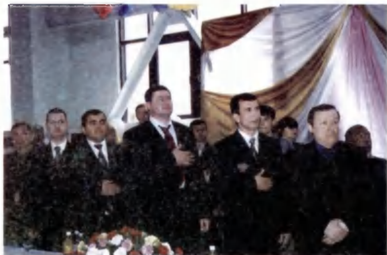
Байроқ кўтариляпти! Мадҳия янграяпти!