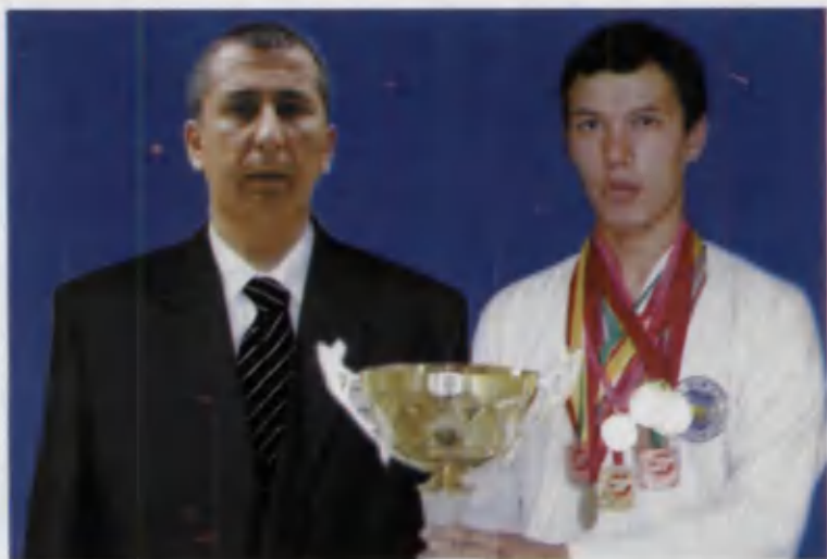
Устозимга ўхшагим келди