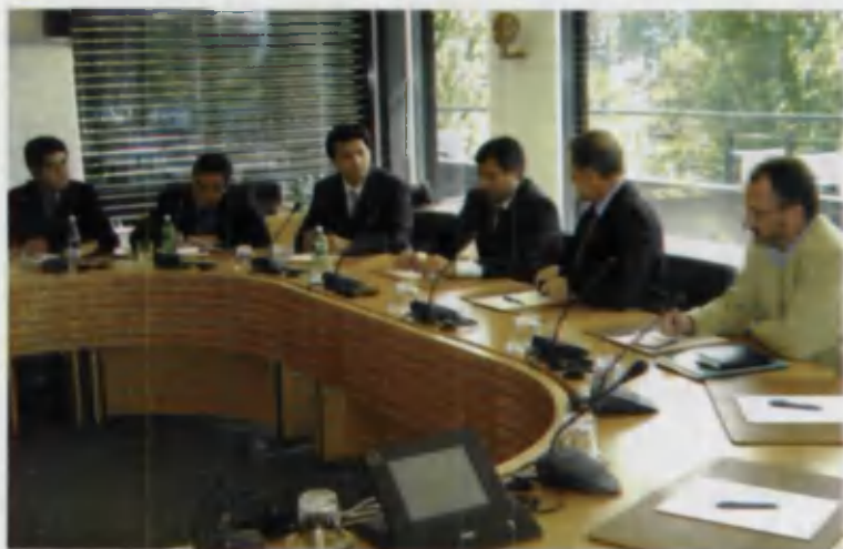
Лозаннадаги учрашувдан лавҳа