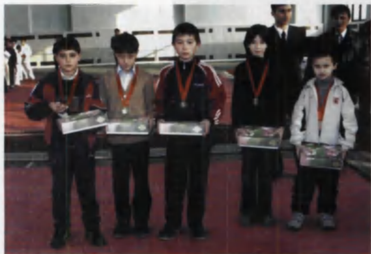
Ўзбек таэквондосининг эртанги вакиллари