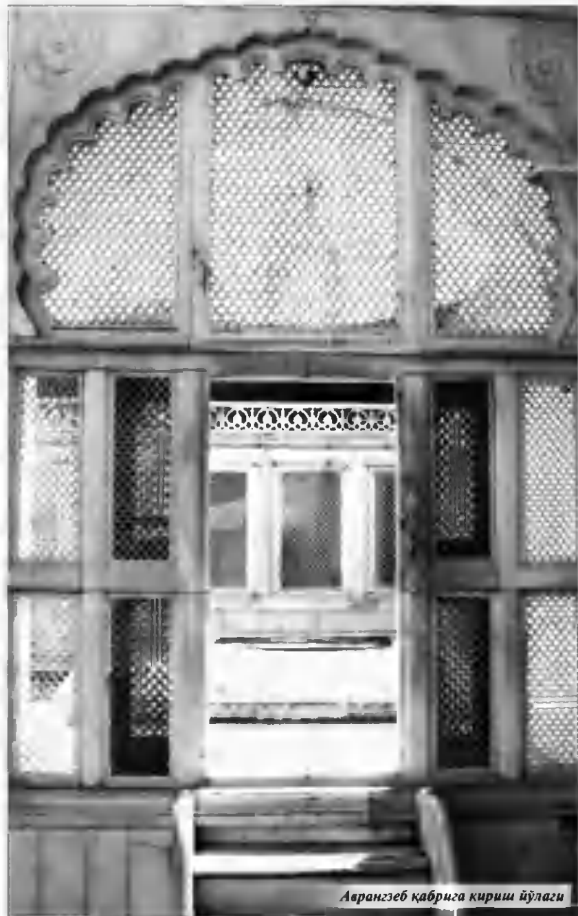
Аврагзеб қабрига қириш йўлаги