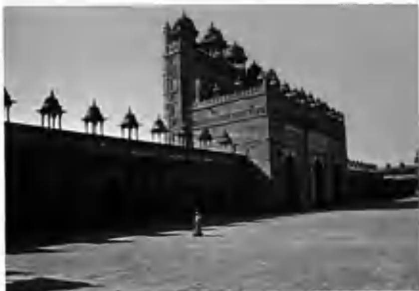
Уттар прадеш Фотеҳпур сикрий шаҳридаги жаме масжиднинг «Баланд дарвозаси» кўринишлари