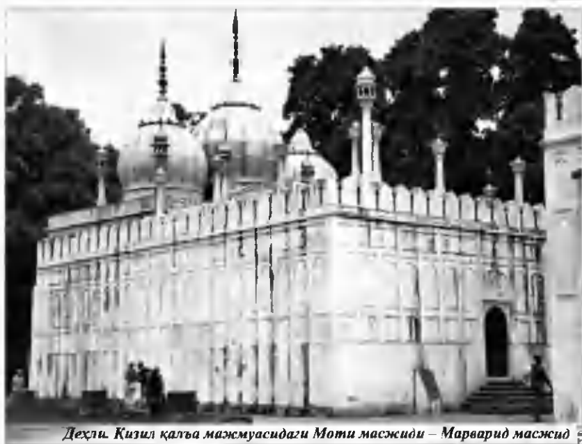
Деҳли. Қизил қалъа мажмуасидаги Моти масжиди – Марварид масжид