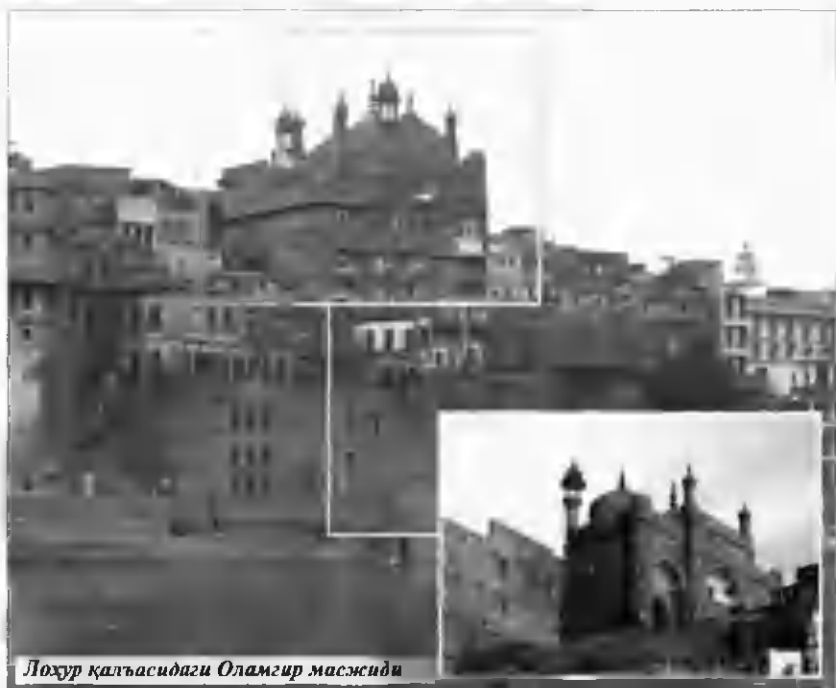
Лохур қалъасидаги Оламгир масжиди